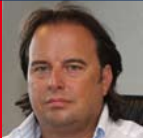
Erwin Cootjans Logwin Road + Rail The Netherlands B.V.